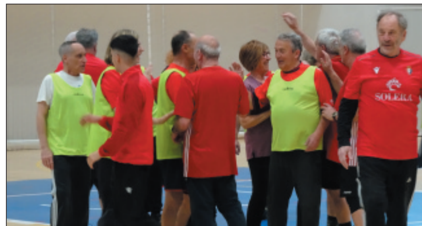
Después de marcar un gol es obligatorio abrazarse.

Es extremadamente divertido y podréis llevar a vuestros nietos para que os animen. Si os atrae la idea comunicármelo personalmente. Quizás me anime a buscar un entrenador (yo era de rugby), un sponsor (para el equipamiento) y a intentar convencer a los del bar de la necesidad de un "tercer tiempo" para que abra después o durante los partidos. Recordad a los romanos: "Mens sana in corpore perito", aunque puede que no fuera exactamente así.