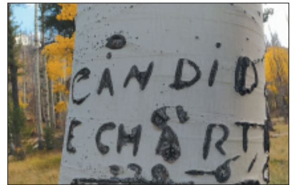
Árbol el que Cándido grabó su nombre.

Lo habitual en los viajes de los pastores de esta época era viajar en avión. Solían ir con un contrato temporal de tres años, prorrogable seis meses, y para seguir trabajando