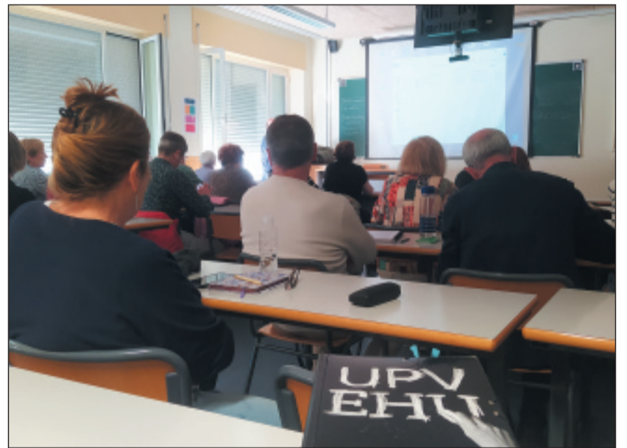
Las clases se imparten de lunes a jueves.

El plazo de preinscripción se abre el 15 de mayo y finalizará el 15 de junio. Es necesario tener cumplidos 55 años antes del 1 de octubre del año en curso y encontrarse en situación laboral no activa definitiva, por jubilación o por incapacidad. Esta condición es incompatible con estar inscrito como demandante de empleo.