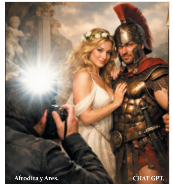
Afrodita y Ares.

El amor de Eros y Psique es un amor imposible que nos traslada a los cuentos tradicionales. Son dos personajes de rango muy diferente: uno divino y otro humano. Surgen