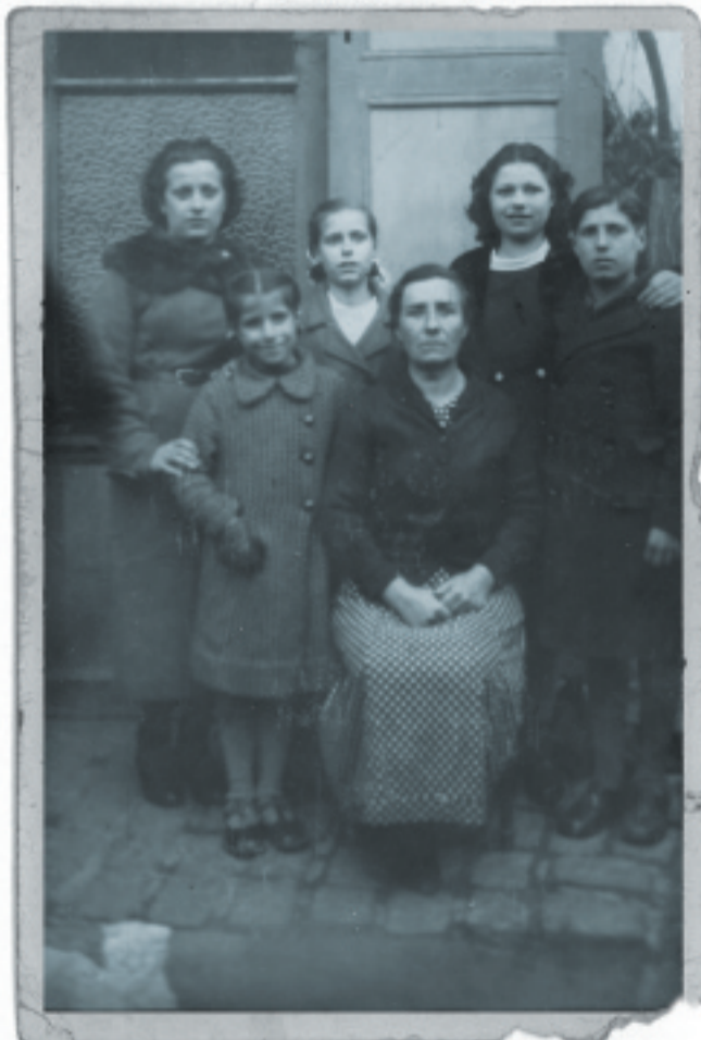
Mi abuela con mi padre y sus hermanas. Francia, abril 1939. A.

Cuando comenzaron a llegar los nacionales a esa zona de Cataluña, mi familia tuvo que volver a Francia. Ahí separaron a mis abuelos, mi abuelo por un lado y mi abuela con sus hijos por otro. No está claro el destino de cada uno, parece ser que los destinaron a campos de refugiados diferenciados por sexo, en los cuales las madres hacían "paquete" con los niños.