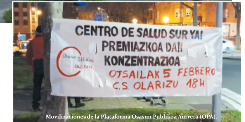
Movilizaciones de la Plataforma Osasun Publikoa Aurrera (OPA).

La salud mental es un requisito esencial para el bienestar general y su cuidado debe ser una prioridad en cualquier sistema sanitario. Un 25% de las consultas médicas en atención primaria son los trastornos mentales más comunes como la ansiedad, la depresión, trastornos de adaptación y trastornos afectivos, junto con problemas neurológicos y por abuso de sustancias. Sin embar-