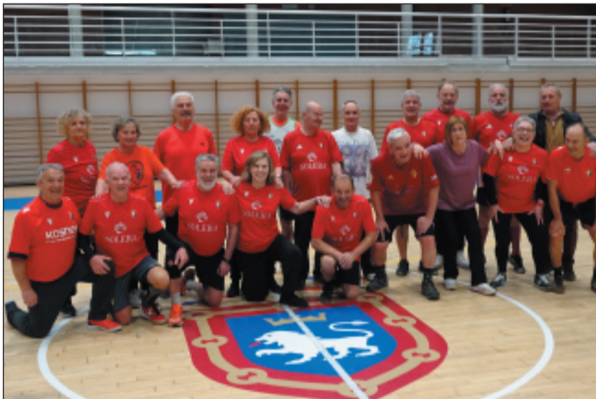
Equipo FutboleANDO posando para La Voz de la Experiencia .

Existe una modalidad de fútbol para personas mayores de 65 años que aúna la diversión, la salud y la amistad.