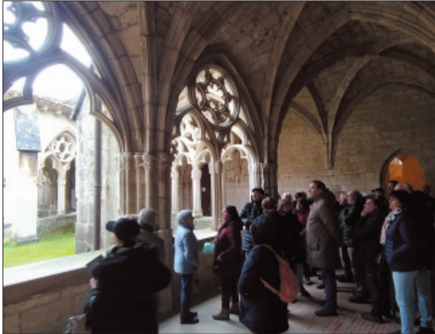
Iruñeko monasterioa bisitatzea.

Ikuspegi berri horien onarpen handiak gure etorkizuneko prestakuntza-proposamenak berri-zen eta aztertzen jarraitzea bultzatzen gaitu. Ohartu gara gure bazkideak ikasteko eta deskubritzeko irrikaz daudela, eta horrek programazio-lerro honekin jarraitzea bultzatzen gaitu. Jarduera bakoitzak ezagutza indibi-