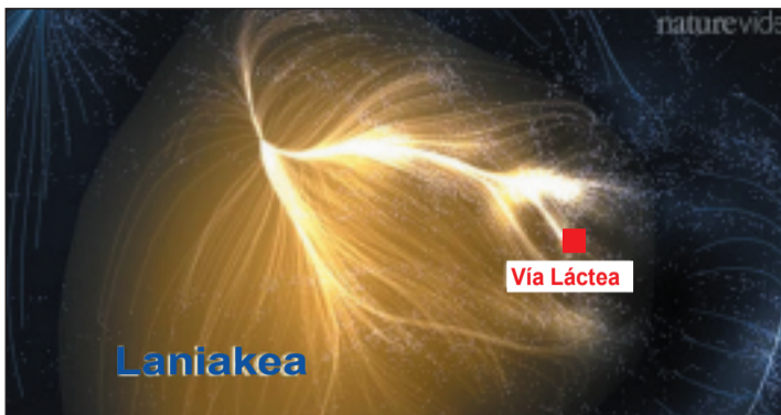
Supercúmulo de galaxias Laniakea.